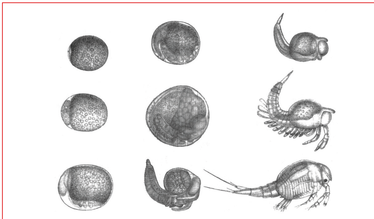
Fig. 1 - Histoire du développement de Nebalia geoffroy (d'après [6]). Stades de développement depuis l'œuf fécondé (en haut, à gauche) jusqu'au crustacé adulte (en bas, à droite).