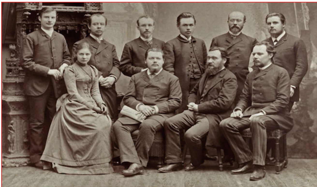
Fig. 2 - Photographie des membres du laboratoire de Metchnikoff à l'Institut Pasteur en 1890.